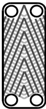
Kanály typu M